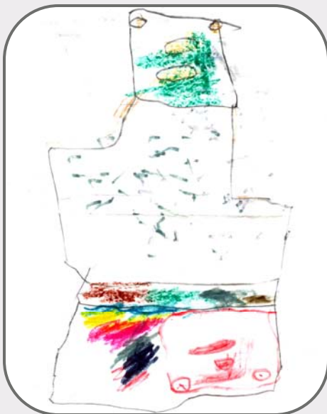
Tekening van Snothi