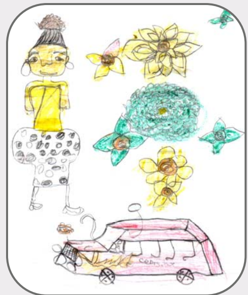
Tekening van Cebo