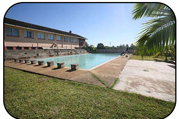
Het zwembad waarin de leerlingen zwemles krijgen