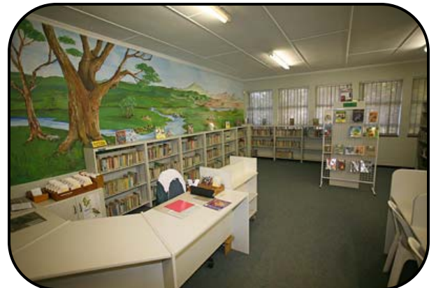
De mooie bibliotheek in de school